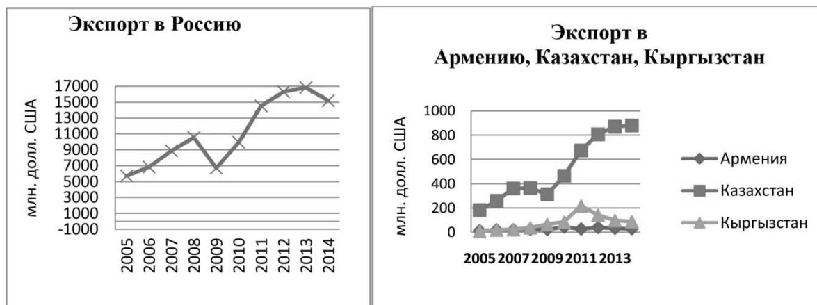
График 1

Из таблицы 5 видно, что основной объем экспорта из Белоруссии идет в Россию. За период с 2005 г по 2014 г. стоимость белорусского экспорта увеличилась почти в 2,7 раза. Однако следует отметить, что повышательный тренд сохранялся все годы, за исключением 2014 г., когда имело место заметное сокращение поставок товаров в Россию, как результат ухудшение экономической конъюнктуры, нарастания кризисных явлений. В 2014 г. стоимость экспорта уменьшилась по сравнению с 2013 г. в абсолютном выражении на 1656,5 млн.долл. США, что составило почти 10%. Что касается Армении и Кыргызстана, то экспорт в эти страны в последние годы имел тенденцию к снижению. Увеличившись в 2011 г. до 218,2 млн. долл. США или более чем в 2,5 раза по сравнению с 2010 г. и